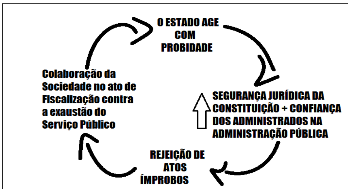
Figura 3- Círculo da Probidade Administrativa

Nesse viés, ilustrando o que seria um novo Círculo, agora baseado em condutas probas, conforme a normatividade constitucional, traz-se as consequências principais desse outro agir do Estado. Dessa forma, tem-se que: