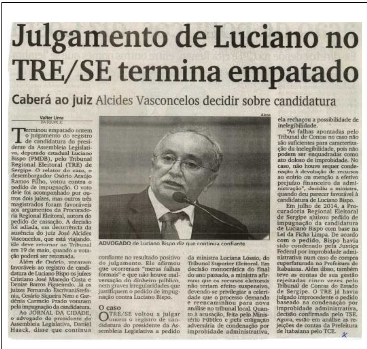
Figura 2- Notícia do Jornal da Cidade, dia 06 Maio de 2015, p. A3.