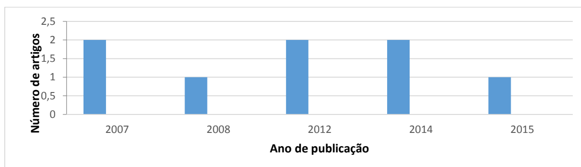
Gráfico 02 - Resultado dos artigos utilizados de acordo com o ano de publicação

Mediante as pesquisas realizadas na base de dados LILACS, MEDLINE, PUBMED e na Biblioteca Virtual SCIELO, que após a triagem resultou em um total