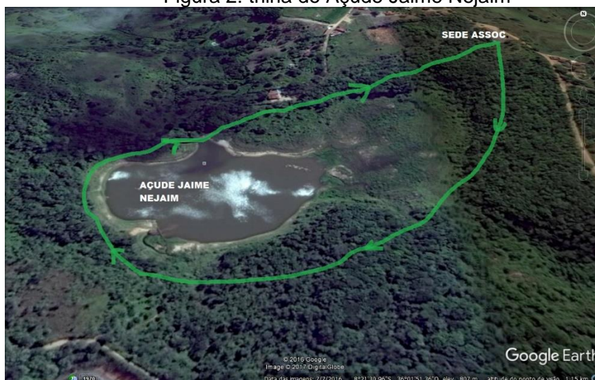
Figura 2: trilha do Açude Jaime Nejaim

Para realização do estudo, utilizou a trilha do açude Jaime Nejaim, uma vez que todas as infraestruturas das trilhas são iguais, sendo a referida trilha a mais utilizada para visitação do Parque. O trajeto da trilha pode ser visualizado na figura 2.